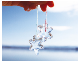
実験で作る氷のペンダント

片山津温泉に生まれ、世界で初めて人工的に雪の結晶を作り出した科学者、中谷宇吉郎博士を記念して建てられた科学館。宇吉郎の多彩な業績に触れるほか、ダイヤモンドダストなどの不思議で美しい実験に大人も子どももわくわくできる施設です。片山津の自然美を表情豊かに感じられる本施設は、2019年にブリツカー賞を受賞した磯崎新氏による設計。六角形の塔は雪の結晶をイメージしたものです。